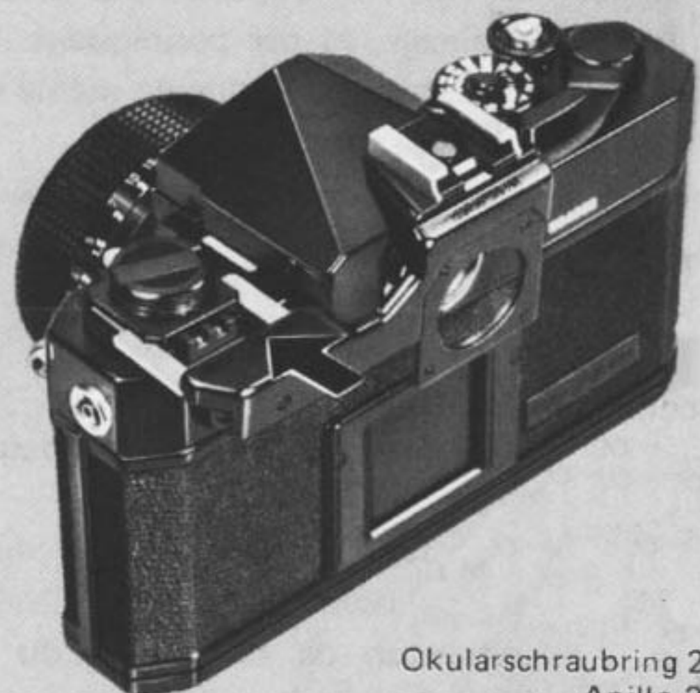
Okularschraubring 2 Anillo 2