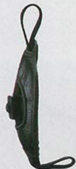
Hand Strap E1 Lets you securely hold the camera with one hand when using the Battery Pack BP-220.