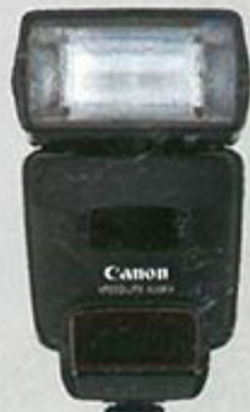
Speedlite 420EX Compact Speedlite with high-precision flash metering, auto zoom head, and wireless sensor. Maximum Guide No. 42 (at ISO 100 in meters)