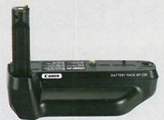
Battery Pack BP-220 External battery pack which enables the camera to be powered by widely-available size-AA batteries instead of lithium batteries. It also has a vertical-grip shutter button.