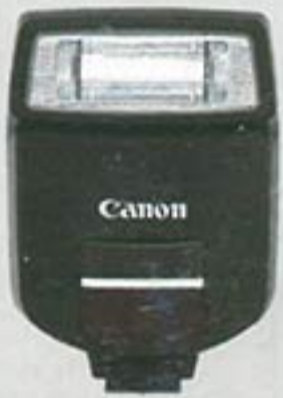
Speedlite 220EX High-performance, compact flash unit. Maximum Guide No. 22 (at ISO 100 in meters).