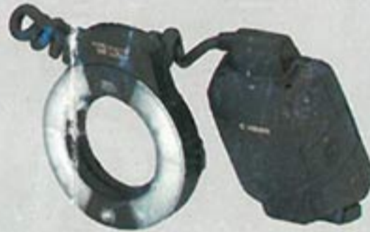
Macro Ring Lite MR-14EX Designed to be mounted on a macro lens, this Speedlite is dedicated to macro flash photography and enables E-TTL autoflash metering. Focus-assist lamps are also built-in. Guide No. 14 / 46 (at ISO 100 in meters / feet).