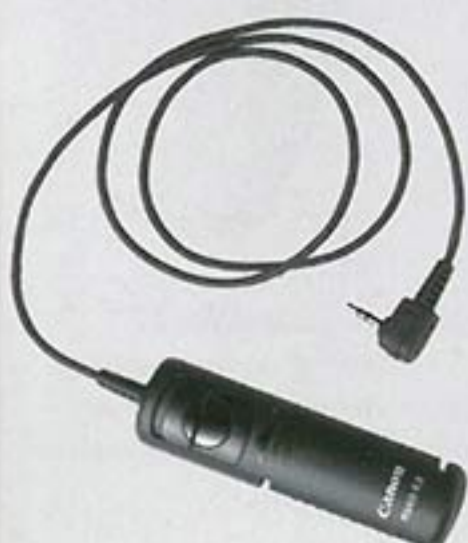
Remote Switch RS-60E3 This is a 60cm cable release for macro shots and long exposures (bulb) when the camera is mounted on a tripod.