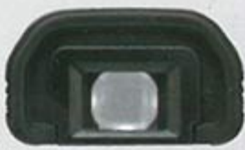
Eyepiece Extender EP-EX15 This extends the eyepiece by 15 mm from the camera body. It relieves your nose from pressing against the camera back.