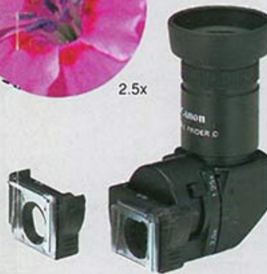
Angle Finder C Convenient for low-angle shots. With the two adapters provided, it can be attached to all EOS cameras.